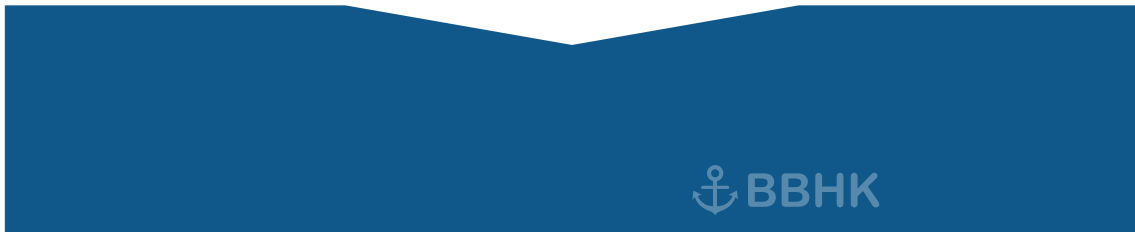
上衣 (3 x 15 厘米)